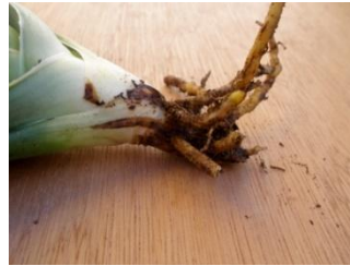
Gambar 4.1 Morfologi Akar Tanaman